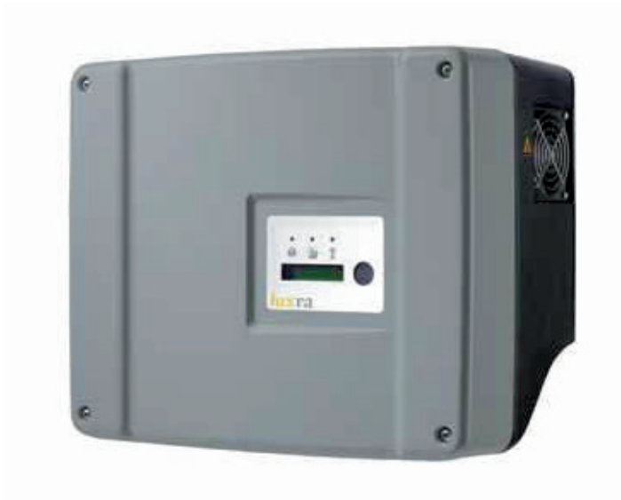
Wechselrichter SK-L 5500 (beispielhafte Abbildung)