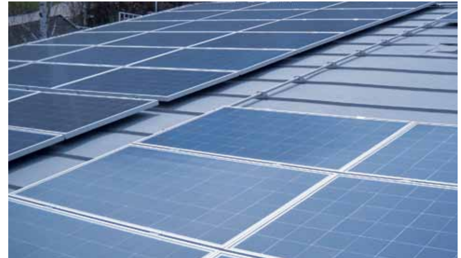
Elpo | Bruneck - Italien Anlage: 66,24 kW | Blechfalz mit S5!