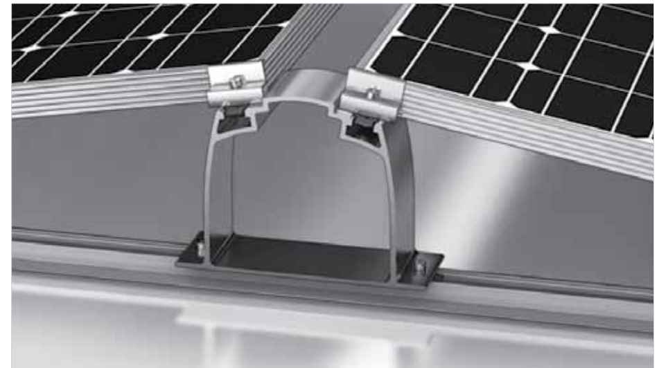
Detail Abbildung - D-Dome System