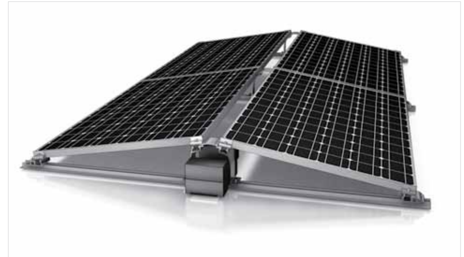
Detail Abbildung - D-Dome System